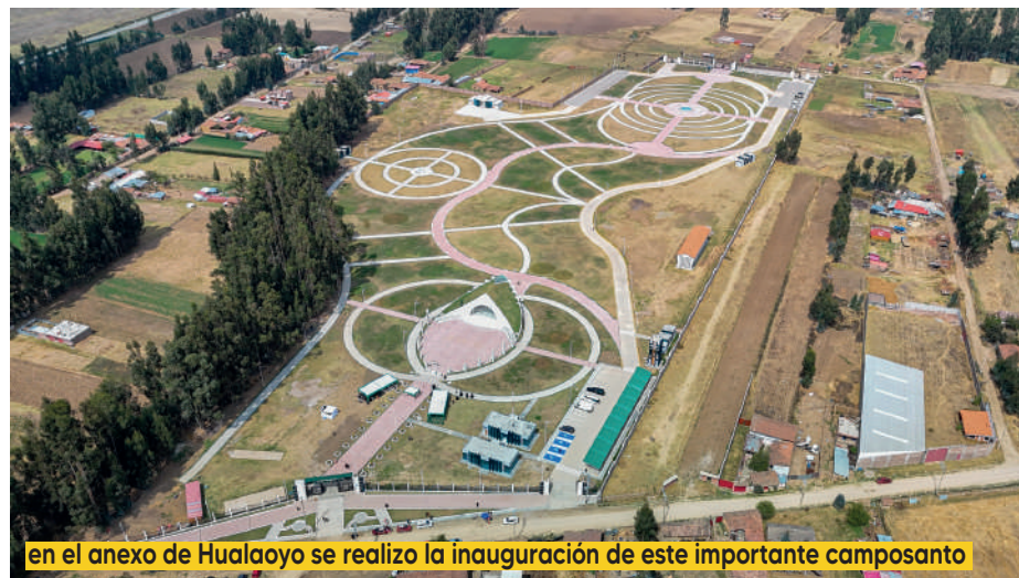
en el anexo de Hualaoyo se realizó la inauguración de este importante camposanto

Cuenta con una capilla multicultos, donde todas las religiones podrán rendir el último adiós a sus seres queridos; también se presentaron las zonas de tumbas subterráneas de cuatro y