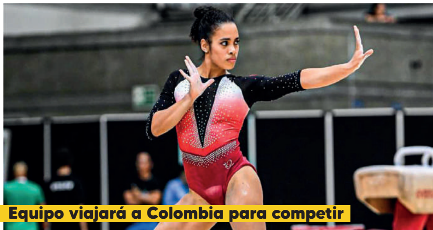
Equipo viajará a Colombia para competir

La selección peruana de gimnasia se alista para el Campeonato Sudamericano de Trampolín Senior y Junior, que se celebrará en Barranquilla, Colombia, del 25 al 29 de septiembre de 2024. Un grupo de 15 atletas partirá hacia Colombia el 23 de septiembre para aclimatarse y entrenar antes del torneo.