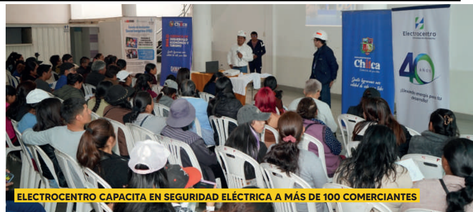
ELECTROCENTRO CAPACITA EN SEGURIDAD ELÉCTRICA A MÁS DE 100 COMERCIANTES

Los especialistas de la empresa eléctrica explicaron sobre la seguridad eléctrica para evitar incendios o electrocuciones. Asimismo, se les pidió adecuar correctamente su lugar de trabajo para evitar accidentes, como no dejar cables colgando, no tocar los interruptores con las manos húmedas, ni sobrecargar los tomacorrientes, así como el uso de un tablero eléctrico,