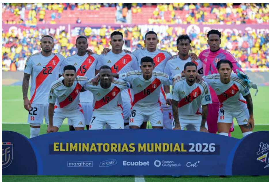
La selección peruana, sin victorias en las eliminatorias